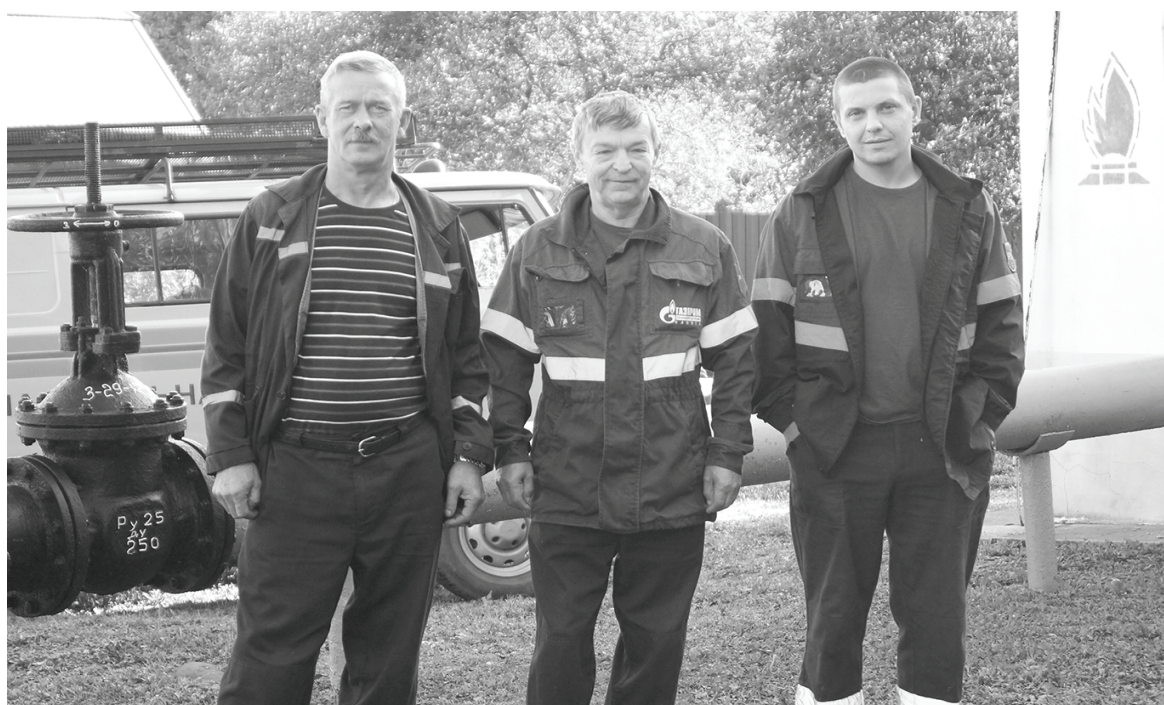
Бригада АВР на одном из объектов.

Аварийно-ремонтная служба работает круглосуточно. Её основные задачи: обеспечение бесперебойного газоснабжения жилых домов, предприятий, ОПО, и ло-